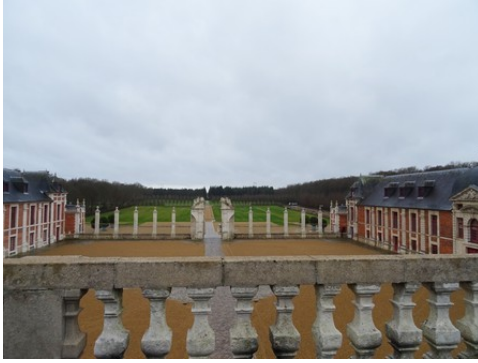
La cour d'honneur (vue vers l'Ouest)