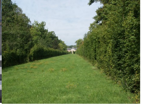
Une perspective sur le chateau