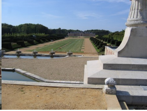
Les jardins et la perspective vers l'Est