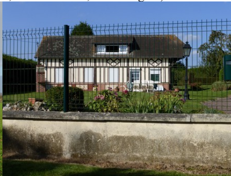
Le bâti rural à pans de bois