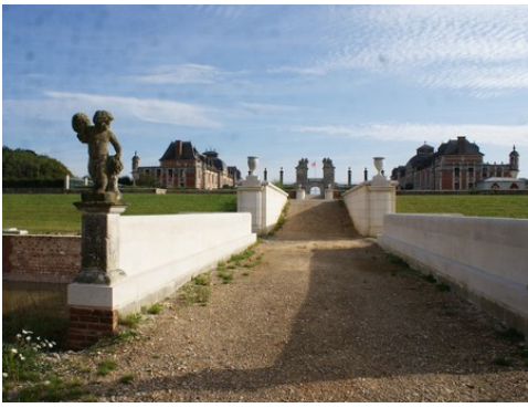
L'accès au chateau