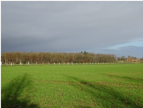
Les champs et les bois autour du domaine

Les avis seront cohérents avec ceux émis ces dernières années, à savoir : pas de maisons à volume compliqué (type V, W, Y, ou Z), pentes à 45° pour les volumes principaux, ardoise ou tuile plate de teinte brun vieilli, à 20u/m², avec un débord de toiture de 20cm, enduit de teinte beige clair avec modénatures (au choix : chaînages, encadrement de fenêtres, soubassement, colombage...). *Voir les autres fiches.